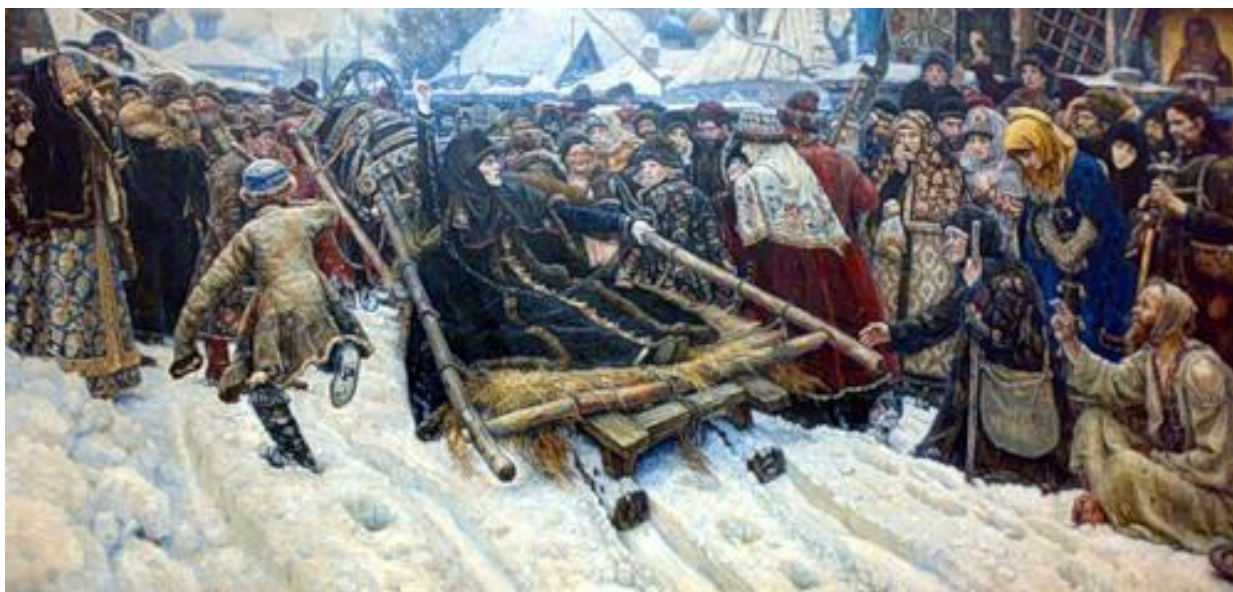
В. Суриков «Боярыня Морозова»

Проанализировать произведение по следующим параметрам: