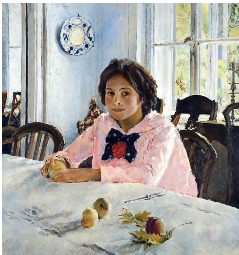
В. Серов. «Девочка с персиками»

Проанализировать произведение по следующим параметрам: